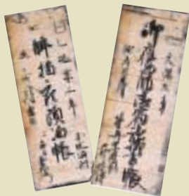
鷹匠、餌指の宿泊費用が書いてある帳簿

日本の鷹狩りのはじまりは古い。奈良時代初めにつくられた『日本書紀』によると、仁徳天皇のころに朝鮮半島の百濟から伝来したという。高橋系