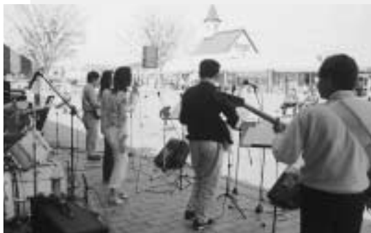
▲スーパーグランマバンドのみなさんによる演奏

4月29日、道の駅はがの2周年を記念したイベントが行われました。ゴールデンウィーク前半のこの日は天候にも恵まれ、会場を訪れた人たちは、暖かい日差しと芽吹きはじめたケヤキに春