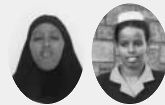
旧アフリカ救済委員会の活動により支えられている奨学生

旧アフリカ救済委員会の活動で集められた奨学金で、就学しているケニアスクールの生徒から手紙が届きました。「最終試験、ゴールが近づいてきました。私の学問探究にも明るい未来が見えています。最終試験で良い成績がとれるよう日々、努力を重ね勉強に奮闘しています」