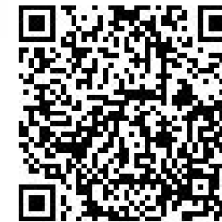
芳賀町携帯電話用 ホームページQRコード

携帯電話のマニュアルで、「QRコード」「2次元バーコード」などとして記載されています。機種によって若干差がありますが、基本的に、内蔵カメラで撮影し、あとは携帯電話がデータを自動的に取り出してくれます。QRコードは、少しぐらいの汚れ、読み取りの向きは上下左右いずれからでも可能です。