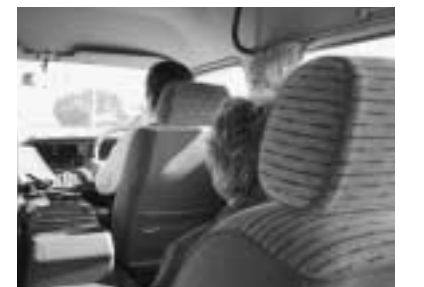
▲「いつもありがとうございます。」