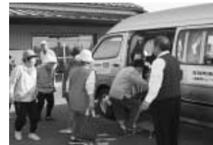
▲「お待たせしました。お乗りください。」

7月に運行を開始したふれあいタクシー「ひばり」は運行エリア内を1回大人300円(子供150円)で玄関から玄関までの送迎サービスを提供しています。自動車などの交通手段がない町民の生活の不便さを解消するべく「ひばり」は今日も走ります。 ◆◆◆◆◆ 今回は南部エリアの送迎に同行させていただきました。 この日は祖母井地区老人クラブのグランドゴルフ大会。芳寿会のみなさんは下与能公民館から総合運動公園までの利用です。代表の方が事前に予約を入れていました。「ひばり」は下与能公民館へ向かいます。 芳寿会のみなさんは以前は