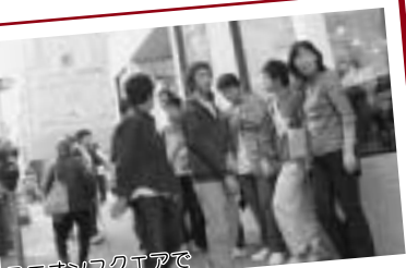
ユニオンスクエアで

11月2日からの10日間、芳賀中生徒22人が海外派遣事業でアメリカサンフランシスコに滞在しました。学校訪問や4日間のホームステイを体験し、アメリカ文化に触れることができました。