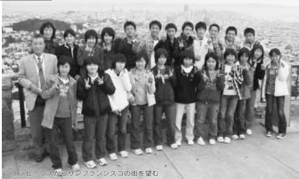
ツインピークスからサンフランシスコの街を望む