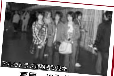
アルカトラズ刑務所跡見学

最初は生徒22人の団長として、みんなをうまくまとめるのが不安でした。でも、アメリカで一日一日過ごしていくうちに、一人ひとりが責任ある行動や団体行動がとれるようになってきました。様々なアメリカ文化に直接触れることができ、皆一回り大きくなって帰ってきたと思います。10日間の海外派遣に感謝します。