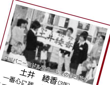
アルバニョーニドルスクールでの自己紹介

私は後半のグループ活動で、ケーブルカーに乗り、ユニオンスクエアやチャイナタウンへ行き、買い物や食事をしました。グレイス大聖堂も見学し、その建物の偉大さとその時間いた美しい鐘の音は、今でも覚えています。