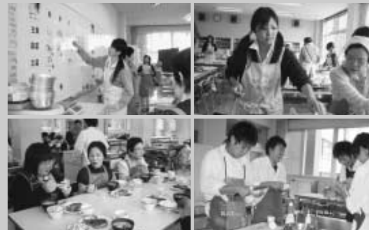
写真:芳賀高生徒を対象とした「ヘルスサポーター21事業」家庭科の授業から