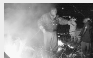
▲西水沼谷近堀の内地区

1月13日、町内の各所でどんど焼きが行われました。正月にやってくる年神様がどんど焼きの煙に乗ってお帰りになると言われています。煤払いに使った竹や神棚の古いお札、だるま、しめ飾りや松飾りなどを燃やし、無病息災・五穀豊稔を祈願する行事で、芳賀町でも古くから行われています。勢いよく燃え上がった炎が周囲を真っ赤に照らし出し、集まった人たちは思わず歓声をあげていました。