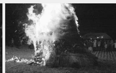
▲西水沼金井島地区