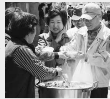
▶きのこ汁サービス