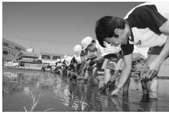
写真上:芳賀北小 写真下右:芳賀南小 写真下左:芳賀東小

5月10日東小、14日南小、21日北小で5年生が田植えを行いました。 はじめは泥に足をとられないうに慣れました。田植え作業に慣れてくると、泥の中で跳ねたり走ったり。田植えが終わるころには体中泥だらけになっていました。 秋にはおいしいお米がたくさんとれるといいですね。