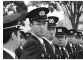
消防団の規律訓練。緊張した表情の新入団員を撮影しました。町民の安全・安心な暮らしを守るため、休日や夜を問わず、非常時に備える皆さんに感謝の念を抱きました。新入団員のみならず、これからよろしくお祈りします。

歯の衛生週間 平成19年6月4日～10日 4 ずっとずっといっしょがいいな自分の歯