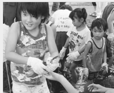
▶マスのつかみどり

毎年恒例のマスのつかみどりやカラオケ、盆踊りでは、子どもからお年寄りまでが参加して、会場を盛り上げました。