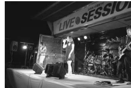
▲ライブコンテスト