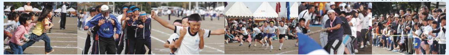
※写真は昨年の様子です