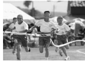
芳賀北小学校の運動会。徒競走をゴールした瞬間のすがすがしい笑顔がとっても印象的です。この写真は北小PTAの船生恭弘さんが撮影したものをお借りしました。ありがとうございます。