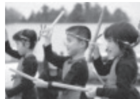
町民祭で行われた水橋保育園年長児の和太鼓演奏。雨の降る寒い日でしたが、子どもたちは元気いっぱい息の合った演奏を聞かせてくれました。