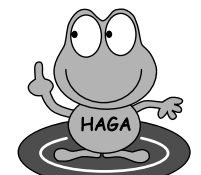
きれいな水にカエルくん

合併処理浄化槽に流れこんだ汚水は微生物の力により分解・浄化されます。消毒された処理水は河川放流または敷地内（地下浸透など）処理されます。