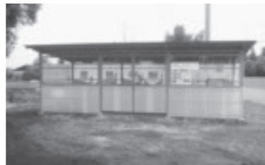
▲上横北エコステーション

平成15年に17カ所のエコステーションで始めた廃プラ回収は、現在70カ所に広がっています。全町エコステーション化で、ごみの減量と分別リサイクルの循環型社会「環の町芳賀」を目指しましょう。※町では、団体や行政区のエコステーション整備費用の1/2(上限5万円)を補助しています。詳細はお問合せください。