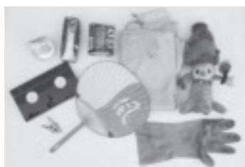
▲プラスチック・発泡トレと一緒に出してはいけないもの(一例)

地域にあるエコステーションは地域公民館や行政区で管理しています。利用できるのは地域の住民のみで、区域外の方は原則利用できません。区域外の方は、各大字のエコステーションを利用してください。