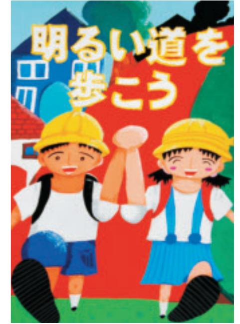
▲真岡署防犯ポスター 中学生の部金賞