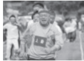
お天気に恵まれた芳賀町民大運動会。皆さんの楽しそうな表情を、数多く写真に収めることができました。「みんなの楽しそうな表情を撮影する時が、一番楽しいな」と、感じました。