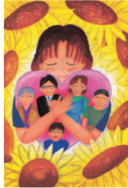
▲「とちぎ教育の日」 ポスター原画最優秀賞