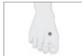
太衝…足の親指と隣の指をV字に結んだ際の谷間