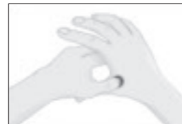
合谷…手の甲の人差し指と親指の骨が交わる内側