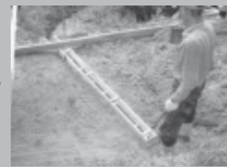
▲水の通り道を作りました