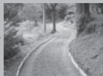
▲木枠を道路の両側に設置します