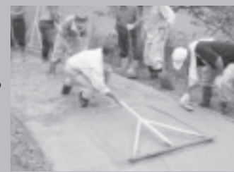
▲コンクリートを平らにします