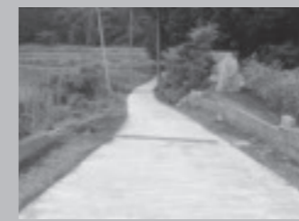
▲コンクリート舗装の完成です