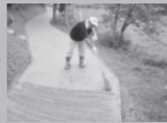
▲滑らないように筋をつけます