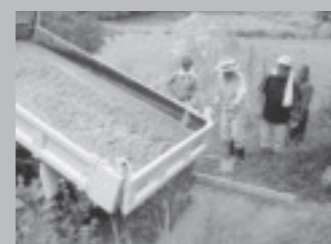
▲コンクリートを流し込みます