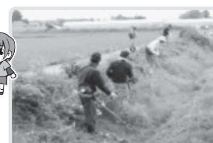
草刈り(下高根沢南部)