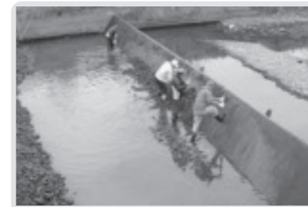
せきの清掃(上延生)