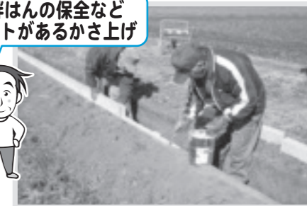
水路のかさ上げ(西水沼)