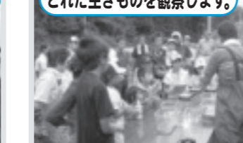
生きもの調査(西高橋)