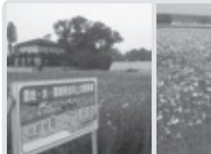
コスモスの植栽(下高根沢北部)