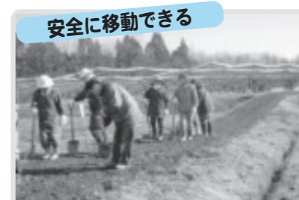
農道砂利敷き(芳志戸)