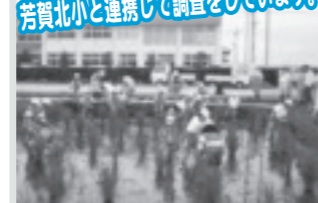
生きもの調査(芳志戸)