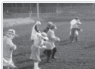
レンゲ草の播種(下高根沢中部)