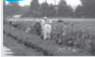
カンナの育成(下高根沢中部)