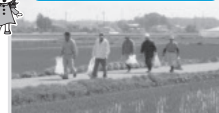
ごみ拾い(下高根沢中部)