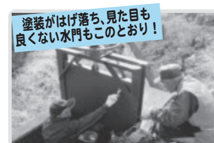
水門の塗装(西水沼)