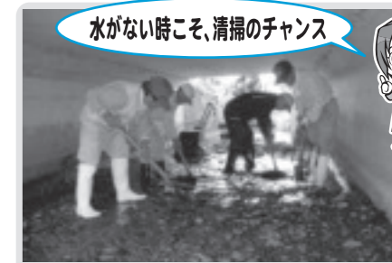
水路の土砂さらい(与能)