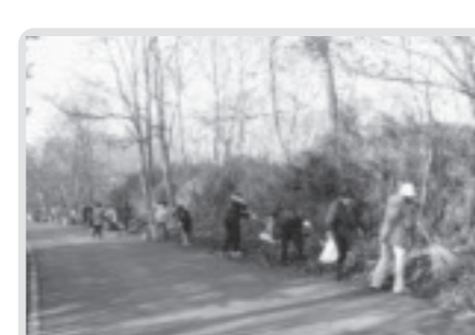
住民全体による清掃(稲毛田)