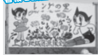
レンゲ草の播種(上給)