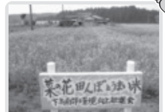
菜の花植栽(下高根沢南部)