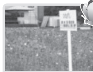
休耕田のひなげし(西水沼)