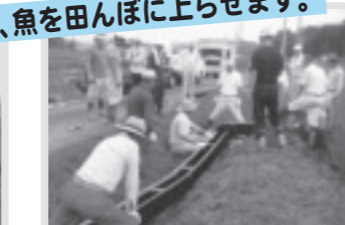
田んぼの魚道設置(稲毛田)