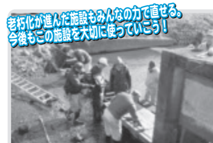
水門木板の加工取り付け(稲毛田)