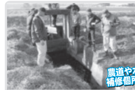
水路施設の点検(下高根沢北部)