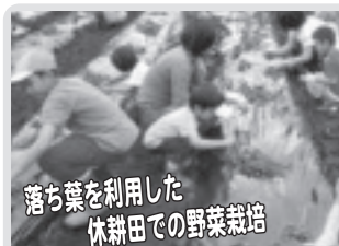
落ち葉を利用した休耕田での野菜栽培 資源循環活動(上延生)