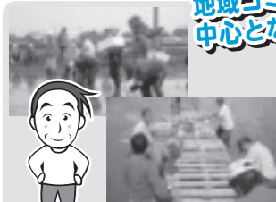
ハスの植栽とさんばしの設置(東高橋)