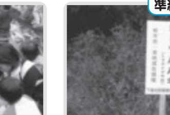
準絶滅危惧種の保護(下高根沢北部)