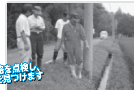
水路施設の点検(西高橋)