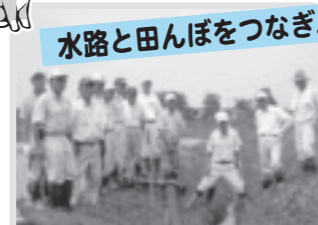
田んぼの魚道設置(西水沼)