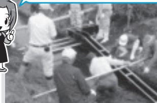
田んぼの魚道設置(与能)