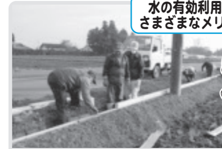
水路のかさ上げ(西高橋)