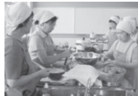
▲食生活改善推進員会員研修～健康レシピの開発～