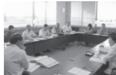
▲設置法人選考委員会の様子

これまで実施された民間保育園設置法人設置委員会の内容と、今後のスケジュールをお知らせします。