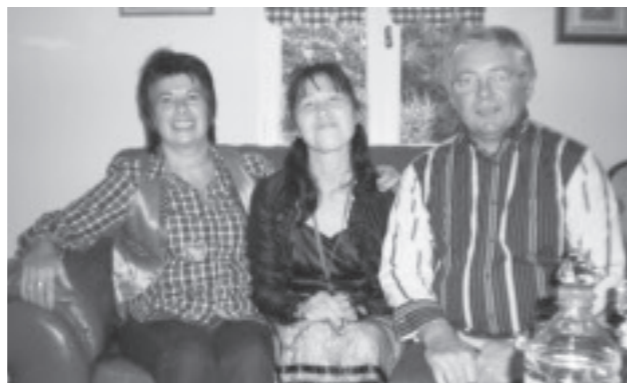
▲ホームステイ先にて

フランスでは、研修先の訪問以外にホームステイも体験しました。ホストファミリーも素敵なお夫婦で家事も協力しながらこなして