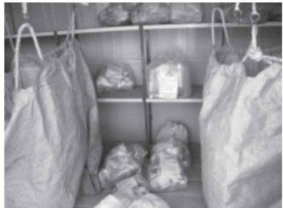
▲不適正なごみが溜まったエコステーション