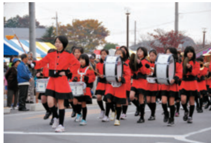
芳賀東小マーチングバンド

11月7日、第29回目となる芳賀町民祭と第25回梨の里マラソン大会が開催されました。