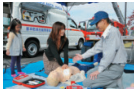
消防芳賀分署コーナー