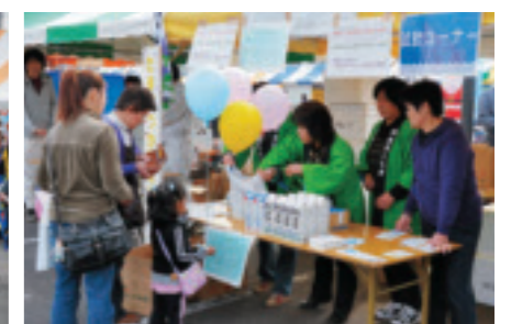
酪農組合コーナー