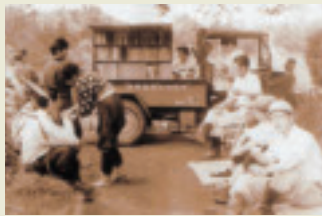
▲移動公民館の昼食風景