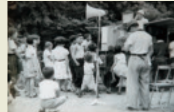
▲移動公民館の紙芝居

ら集落で映画会や座談会を開くので、終わるのが夜の11時ごろになり、寒さに震えていることもあり、こんなにもできて、どうして移動公民館に協力せねばならないのかと考えたときもありました。しかし、回を重ね、集落の人たちと親しむうちに、考えが変わってきました。移動公民館は、名前は公民館ですが、移動農業改良普及所、移動農協、移動役場のようなものです。現在では公民館に協力しているんだという気持ちではなく、自分の役場の仕事をしているんだと考えるようになってきました。