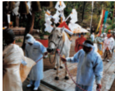
『御祓い』 佐海忠夫 (真岡市) ●天満宮 (西水沼)