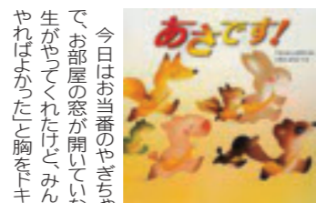
あさです! いもとようこ(佼成出版社)

今日はあさのやぎちゃんがお休み で、お部屋の窓が開いていない。ミウ先 生がやってくれたけど、みんなは「自分 がやればよかった」と胸をドキドキさせ て、