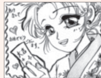
▲直のママさん(祖母井)