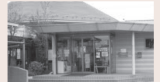
上高根沢ふれあいセンター (高根沢町図書館上高根沢分館)