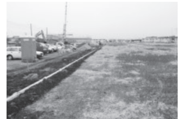
建設が進むJRバス関東の支店と隣接するバスターミナル予定地