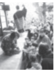
▲のぶ幼稚園児にも ▲城興寺の豆まき