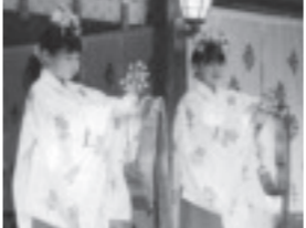
▲祖母井神社「浦安の舞」