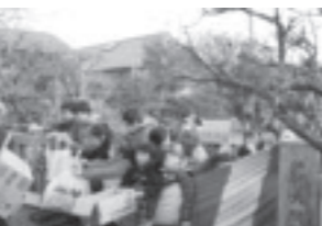
▲祖母井神社の豆まき