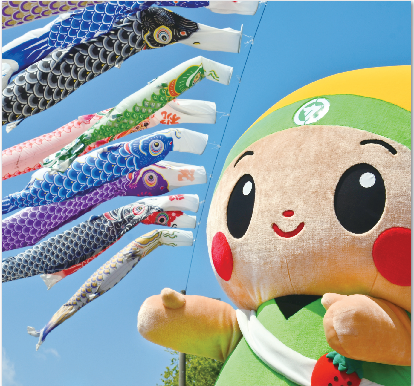
4月22日 はがまるくとこいのぼり(役場前)