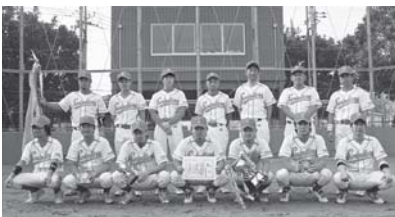
▲スウィンドラース