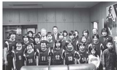
▲芳賀北バレーボールクラブ(町長表敬訪問)

全国スポーツ少年団バレーボール交流大会 芳賀北バレーボールクラブが栃木県代表として全国大会に出場し、4試合を行い2勝2敗の成績でした。