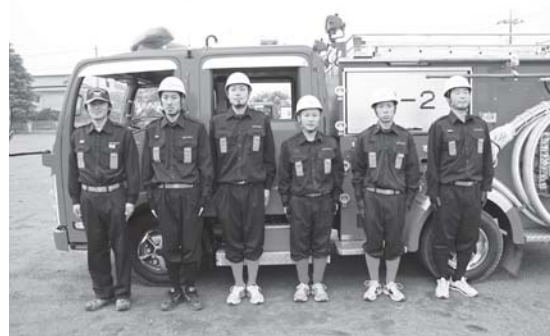
左から部長、指揮者、1番員、2番員、3番員、4番員