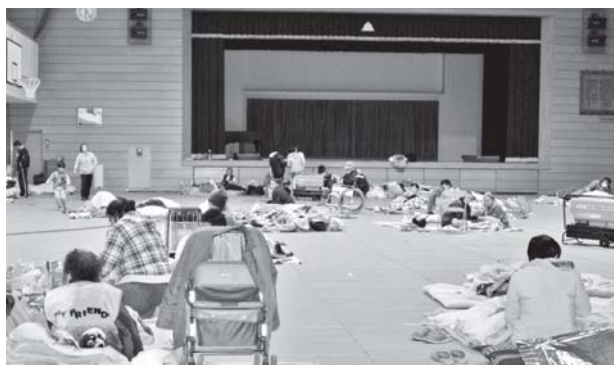
▲東日本大震災時の避難所の様子

今後も定期的に、防災に関する情報を、広報はがや芳賀チャンネルでお知らせしていきます。