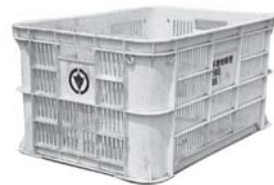
黄色のコンテナ (青のコンテナの代わりに使用できます。)

A: 指定のコンテナを使用してください。ペットボトルは青のコンテナ、缶類は黒のコンテナ、もえないごみは青のコンテナです。ただし、「♻️」マークが刻印されている黄色のコンテナを、青のコンテナの代わりに使用することができます。