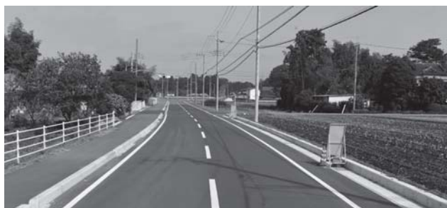
▲道路新設改良工事（芳志戸地区市の堀線） 3,454万円