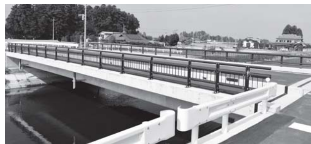
▲芳志戸金井橋橋梁工事（上部・下部） 8,432万円