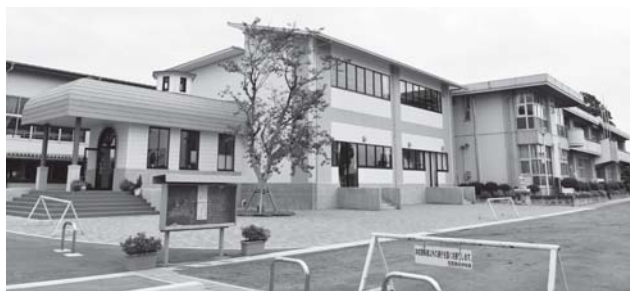
▲芳賀東小学校増改築工事 1億3,589万円