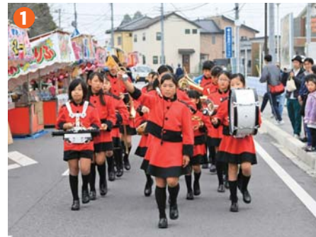
1 ▲芳賀東小マーチングバンドで 町民祭がスタート