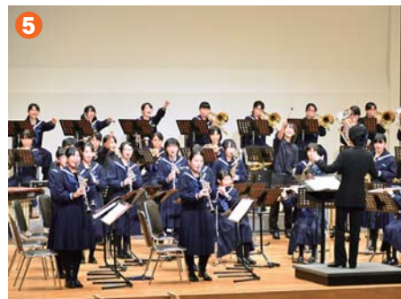
5 ▲素晴らしい演奏で聴衆を魅了した 芳賀中吹奏楽部