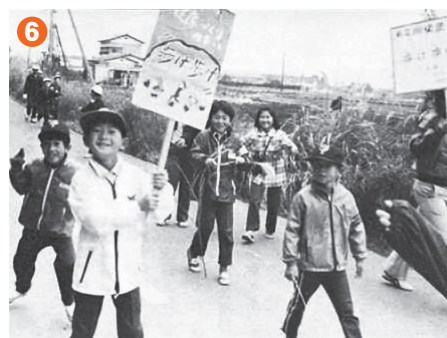
6 ▲多くの人が参加した「歩け歩け」 (昭和55年)