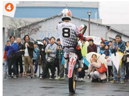
4 ▲高度な技の連発に会場が沸いた バイクトライアルのデモンストレーション