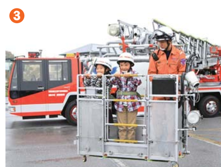
3 ▲人気のあった はしご車搭乗体験