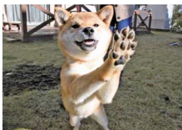
ショコラちゃん(柴犬、メス)

あなたのかわいいペットを紹介します。とっておきのショットをお送りください。※毎月10日締切