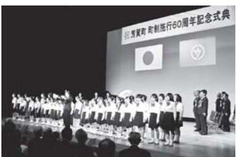
芳賀町町制施行60周年記念式典

町制施行60周年を記念した式典を、町民会館で開催。児童文学作家の漆原智良先生が記念講演を行ったほか、子どもたちが「芳賀町子ども憲章」を発表。