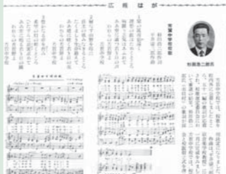
▲「芳賀中学校の校歌きまる」 広報はが昭和46年2月（第187号）