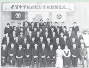
芳賀中学校校歌制定校旗樹立式

中学校は、昭和22年に3つの旧町村に各1校ずつ開校されました（写真①～③）。その後、昭和43年から統合計画が始まり、昭和45年に現在の町内唯一の芳賀中学校として統合されました。当時における中学校の統合は、郡内では初のことでした。新中学校は、統合当時は旧3校の校舎を使用し、新校舎完成後の昭和47年4月に実質的な開校を迎え（写真④）、現在に至ります。 町では、将来を担う子どもたちが、充実した学校生活を送り、健やかに成長できるように、施策に取り組んでいます。