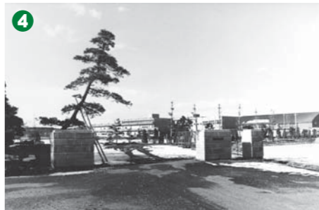
1 旧祖母井中学校（昭和40年代） 2 旧南高根沢中学校（昭和40年代） 3 旧水橋中学校（昭和40年代） 4 開校間もない芳賀中学校（昭和48年）