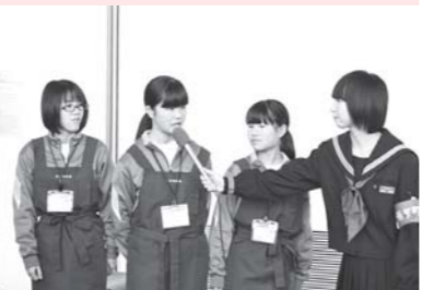
インタビューにドキドキ