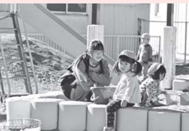
子どもの世話は大変だ