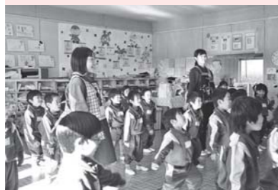
子どもたちとダンスタイム!