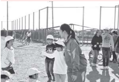
みんなで仲良く遊ぼうね