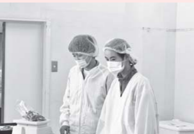
パンおいしそうだなあ