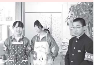
インタビューまとまるかな