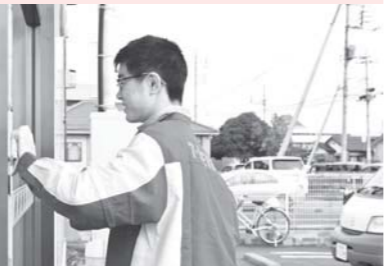
ピカピカになって気持ちいい