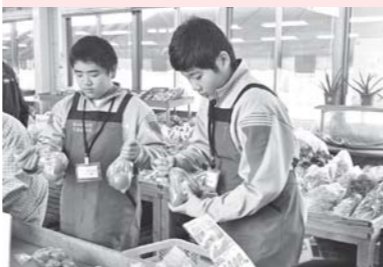
う〜ん、配置どうしよう