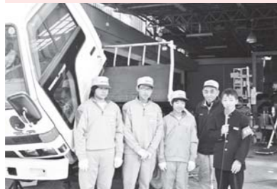
インタビューは緊張します