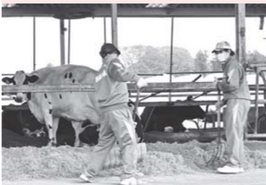
たっぷり食べてね