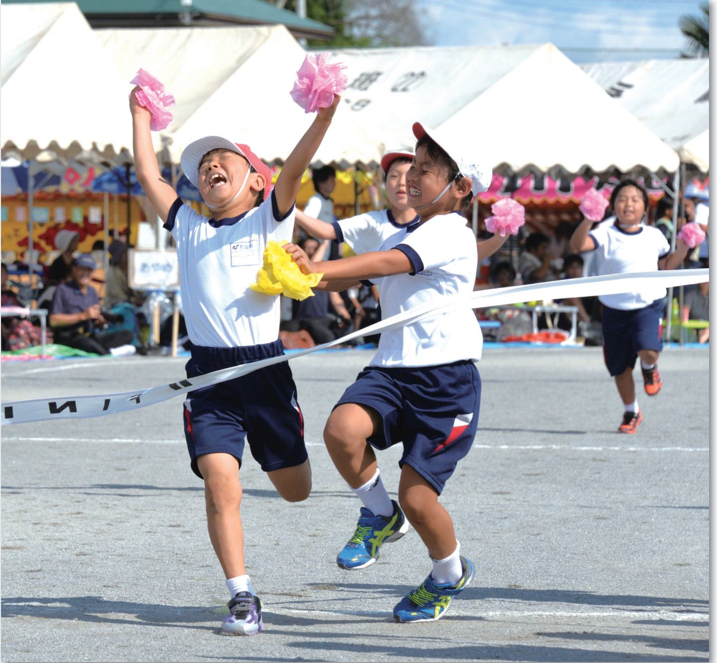
9月19日 運動会(芳賀南小学校)