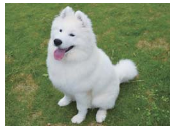
マッシュくん(サモエド、オス)

あなたのかわいいペットを紹介します。とっておきのショットをお送りください。※毎月10日締切