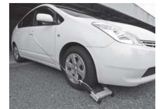
▲差押え例 (タイヤロック)