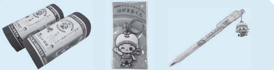
▲はがまるくんロールケーキ ▲キーホルダー ▲ボールペン

道の駅はが物産館では「はがまるくん」のオリジナルグッズやお菓子を販売中です。ぜひおみやげ品やプレゼントにどうぞ。