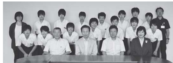
▲8月28日芳賀中バレーボール部が役場にて町長に結果報告

◆全国中学バレーボール選手権大会 期日/8月21日(金)～24日(月) 会場/忠和公園体育館 (北海道旭川市) 結果/芳賀中バレーボール部 ベスト16