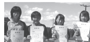
▲中学生女子入賞者