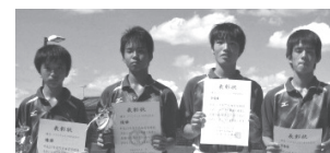
▲中学生男子入賞者

◆町民ソフトテニス大会 期日／9月20日（日） 会場／与能テニスコート 結果／優勝