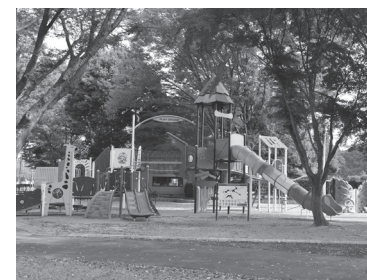
▲総合運動公園遊具広場整備工事 2,871万円