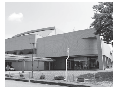
▲町民会館調光舞台照明改修工事 8,458万円