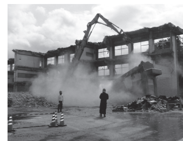
▲旧芳賀高校校舎解体工事 2億390万円