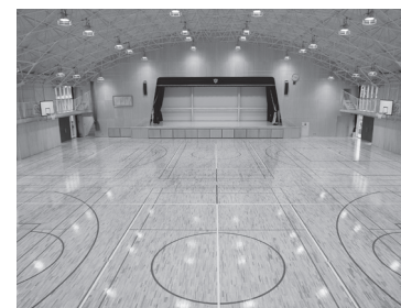
▲芳賀中学校体育館耐震補強および大規模改造工事 2億5,304万円