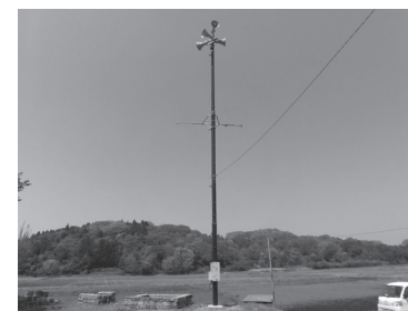
▲情報無線デジタル化更新工事 4億2,888万円