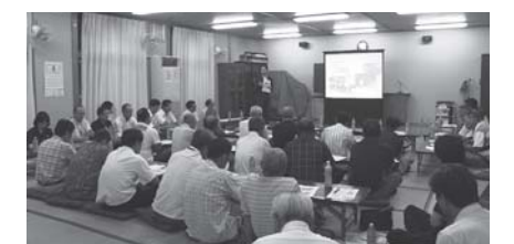
▲地区座談会の様子

町民満足度調査結果と中村教授のコメント全文は、町ホームページに掲載していますので、ぜひご覧ください。