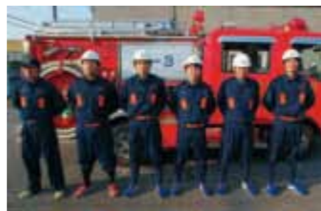
▲左から部長、指揮者、1番員、2番員、3番員、4番員