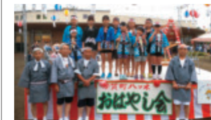
▲夕涼み会に貸し出した時の様子

八ツ木自治会では、地域交流の場として毎年盆踊りを実施していますが、これまで使用していたやぐらの老朽化が目立っていました。そこで、一般財団法人自治総合センターが宝くじの社会貢献広報事業として実施している平成28年度コミュニティ助成事業を活用し、新しいやぐらを購入しました。盆踊り以外にも、認定ひばりこども園の夕涼み会の際に貸し出すなど、さまざまなイベントで活用されます。