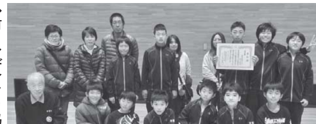
▲芳賀北男子バレーボールクラブ

◆第5回県スポーツ少年団男子バレーボール秋季大会 期日/12月13日(日) 会場/茂木町民体育館 結果/準優勝 芳賀北男子バレーボールクラブ