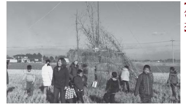
【八ッ木】 伝統を受け継いで 町内各地でどんど焼き (7月10日(日))

味噌おでんやフランクフルト、とん汁、さらに地元消防団員によるポップコーンなどが振る舞われました。正午過ぎ、申年生まれの年男女の人を中心にどんど小屋に火をつける、炎は一気に燃え上がりました。