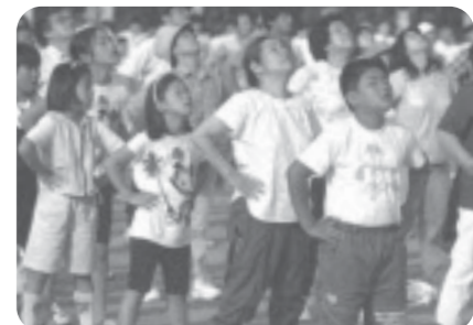
▲20年前に芳賀町で開催されたときの様子

当日の様子はNHKラジオ第1で生放送される予定です。町民2,000人の参加を目標としていますので、皆さんの参加をお待ちしています。