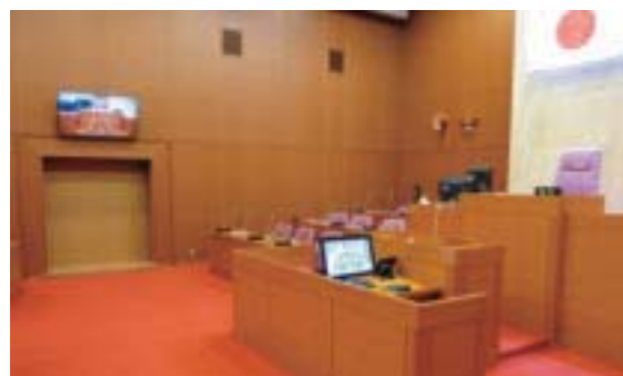
▲議場音響設備改修 設計業務214万円/改修工事2,399万円