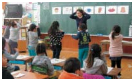
▲ALT(外国語指導助手)の配置 1,114万円