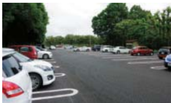
▲かしの森公園駐車場整備 設計業務303万円/整備工事2,269万円