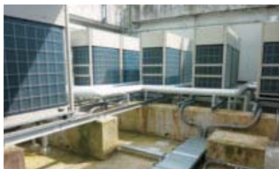
▲役場空調設備改修 施工管理業務286万円 改修工事1億4,411万円